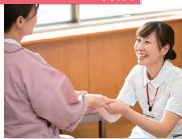
心のこもった看護

各種専門医による丁寧でわかりやすい診察を実施。迅速・的確な医療提供を心がけています。