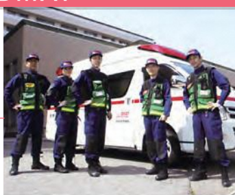
DMAT (災害派遣医療チーム)

本院では2組のDMATを編成。また、災害医療活動用資器材が搭載可能な災害対応救急自動車も配備。有事にも対応できる体制を整えています。