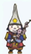
高岡市キャラクター 利長くん