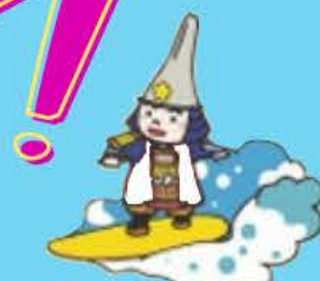
高岡市キャラクター 利長くん